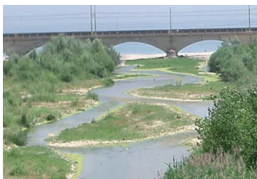
La foce del fiume Aso

Dopo questo complesso lavoro di elaborazione dati sono stati individuati gli indirizzi e le linee guida da perseguire in modo che i gestori pubblici abbiano a disposizione tutte le informazioni necessarie per poter predisporre una corretta pianificazione/gestione/progettazione del corso d'acqua e delle aree limitrofe in connessione con esso.