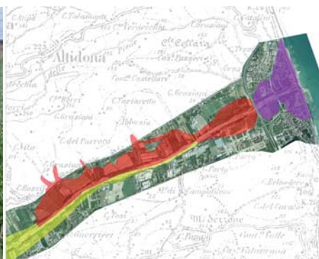
Aree a rischio esondazione